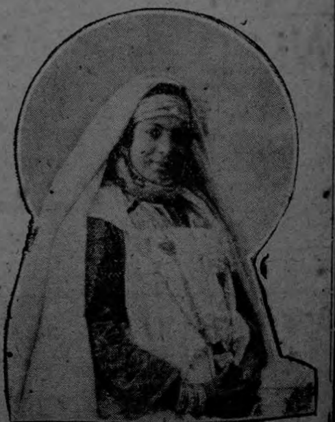
(Especimen de los grabados)